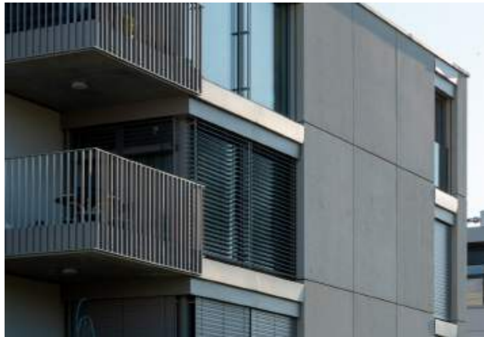
Residenza Honolulu Littoral Parc, Etoy (VD) Terziario