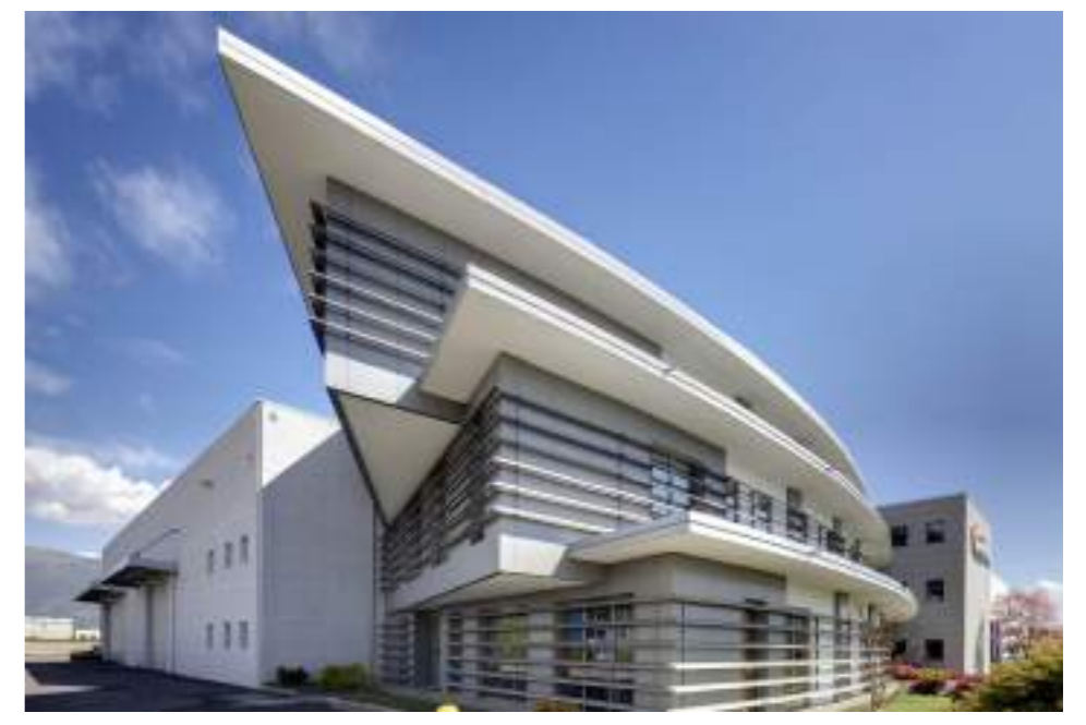
GFM Mapello (BG) Produttivo