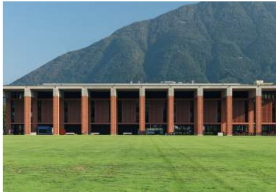
Centro Sportivo Nazionale della Gioventù Tenero-Contra (CH) Terziario