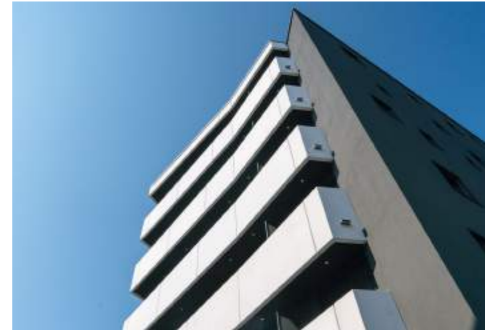
Residenza Gapsa Breganzona (CH) Terziario