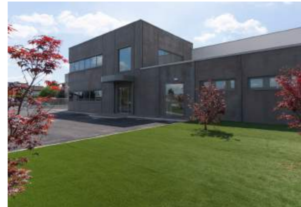
CGS Cureggio (NO) Produttivo