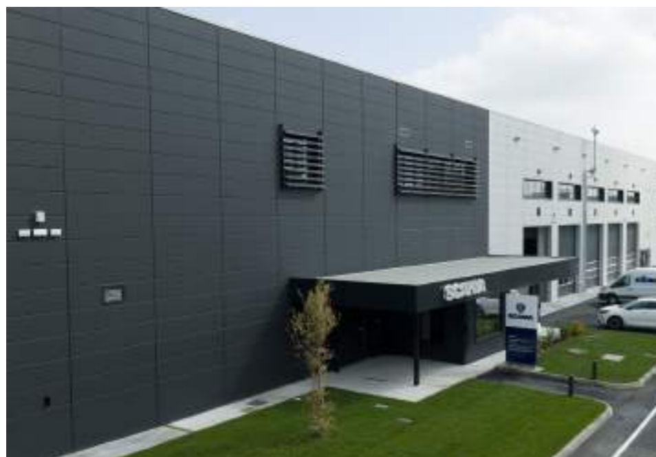
Scania Milano Produttivo