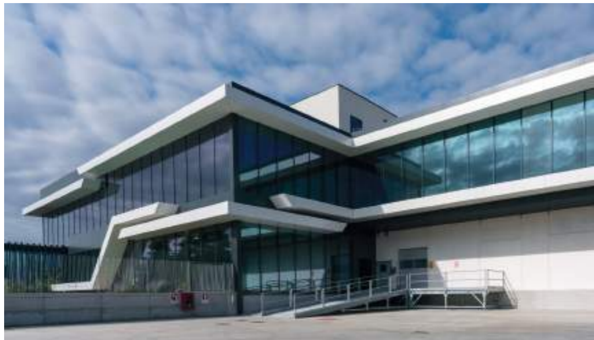
Oxyturbo Lonato del Garda (BS) Produttivo / Logistica