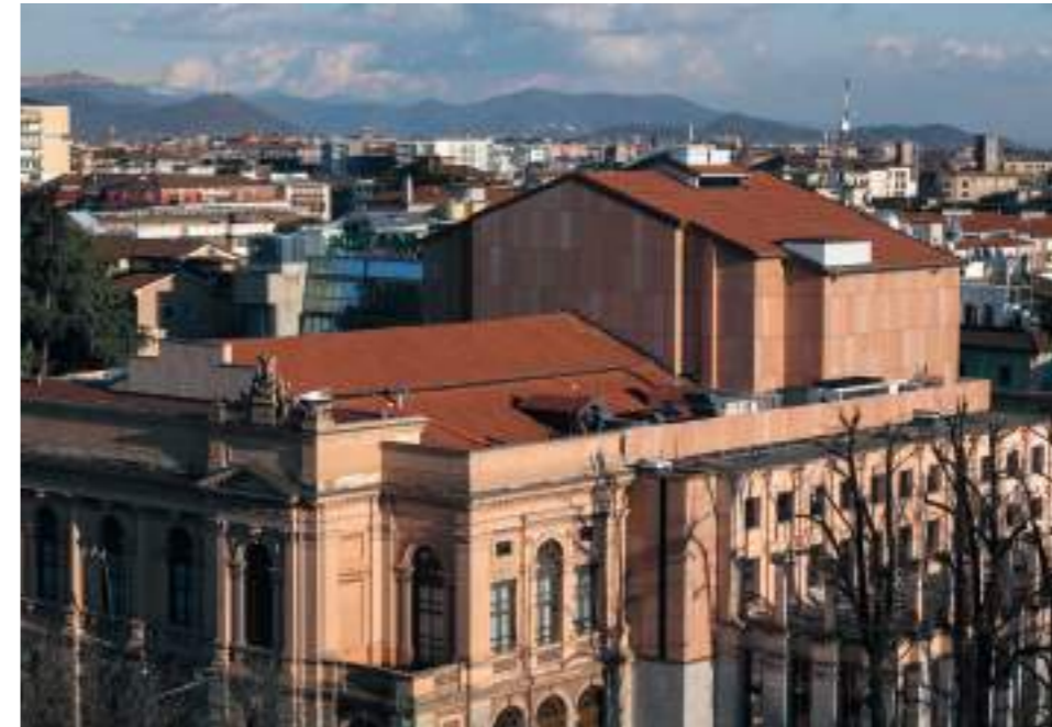
Teatro Donizetti Bergamo Terziario

Progetti che ridisegnano i panorami urbani, danno casa ad aziende del territorio e contribuiscono a costruire un futuro più sostenibile.