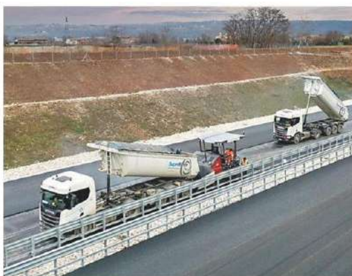
I mezzi di SuperBeton al lavoro lungo la Pedemontana