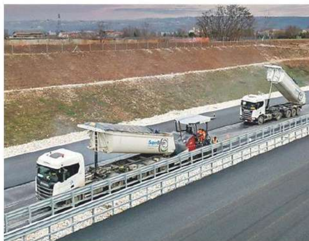
Mezzi di SuperBeton al lavoro lungo la Pedemontana