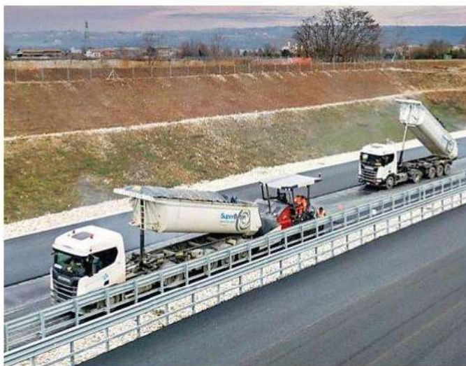
I mezzi di SuperBeton al lavoro lungo la Pedemontana