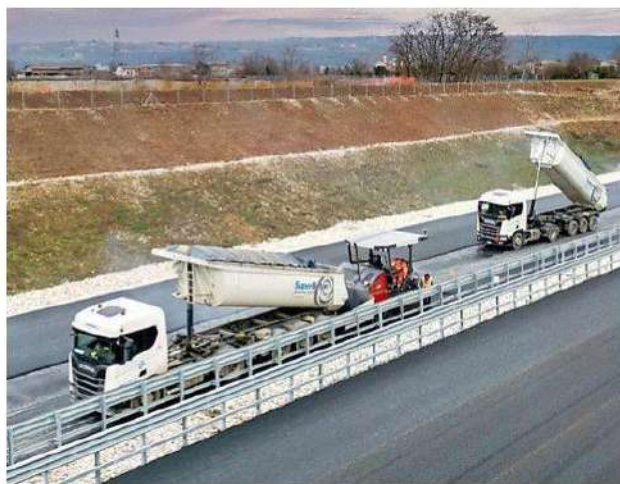
Immezzi di SuperBeton al lavoro lungo la Pedemontana